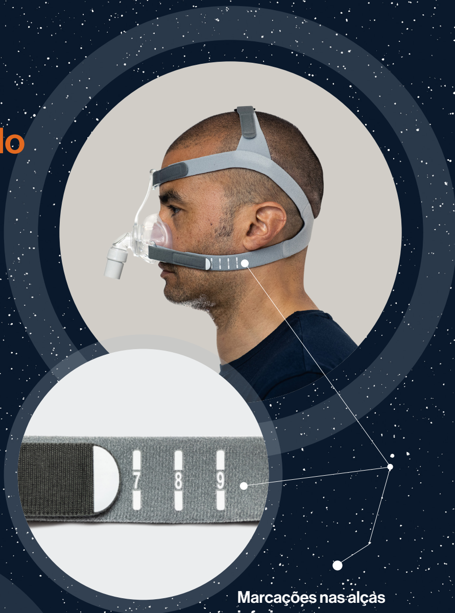
Marcações nas alças inferiores

Ajuste Rápido,, o sistema de marcação do arnês Univeo Delta (patenteado)